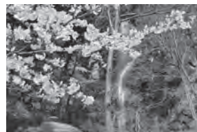
「不動の滝(桜)」